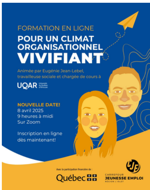
TABLE DES RH

Regroupant les gestionnaires des ressources humaines d'entreprises de la région, elle offre des formations professionnelles de calibre universitaire et organise des rencontres pour permettre aux employés et gestionnaires RH de parfaire leurs connaissances et d'échanger avec d'autres professionnels.